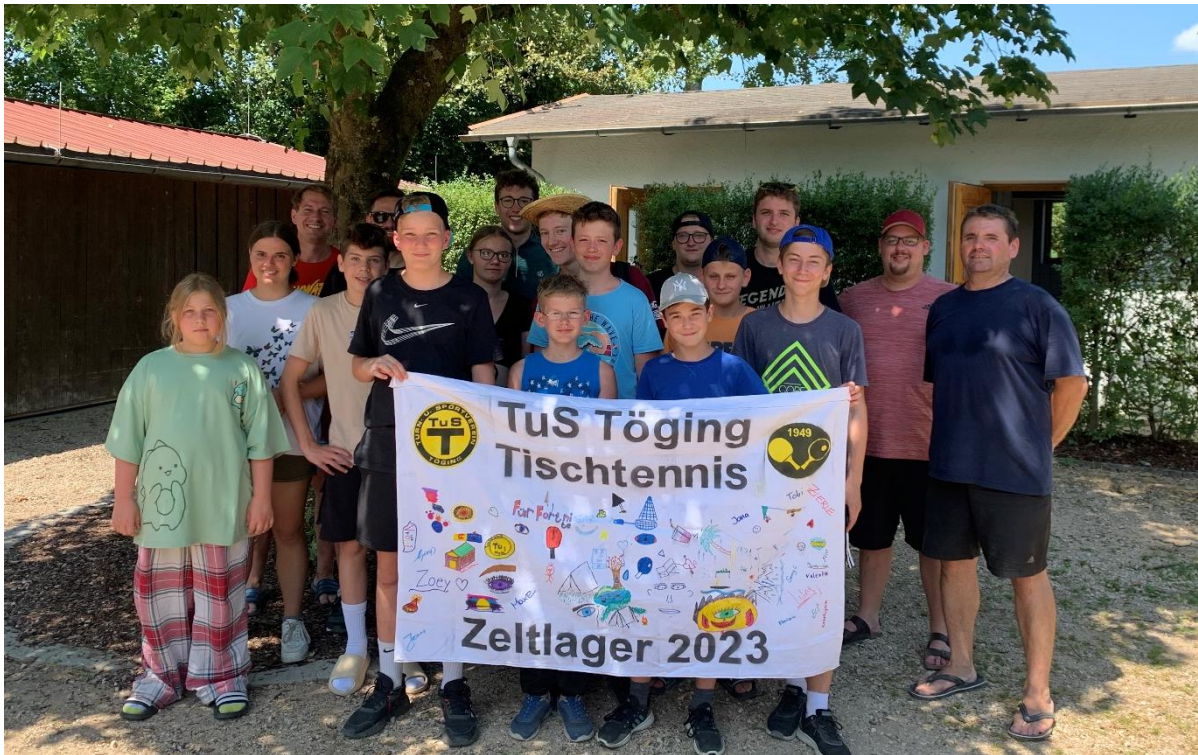
Gruppenfoto vom Zeltlager mit selbst gestalteter Fahne

Nach einem Jahr Pause fand vom 14. bis 16. Juli wieder das traditionelle Zeltlager am Peracher Badensee statt. Zu Beginn durften die Jugendlichen ihre Kreativität beim Bemalen der Zeltlager-Fahne zeigen. Auch wurde wieder die „Lager-Olympiade“ ausgespielt, in der die Teilnehmer bei verschiedenen Spielen wie beispielsweise Hockey, Boccia, Wasserball oder Dosenwerfen ihre Geschicklichkeit unter Beweis stellten. Die anstrengenden Tage mit viel Badespaß im See hat man am Lagerfeuer mit Stockbrot und Würstchen ausklingen lassen.