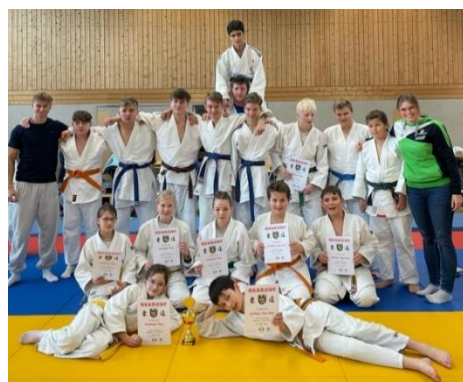
Jugendliga Mannschaft Töging